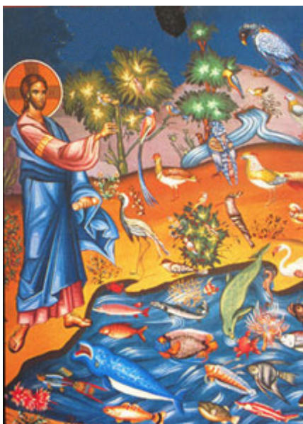
icône orthodoxe Dieu Créateur